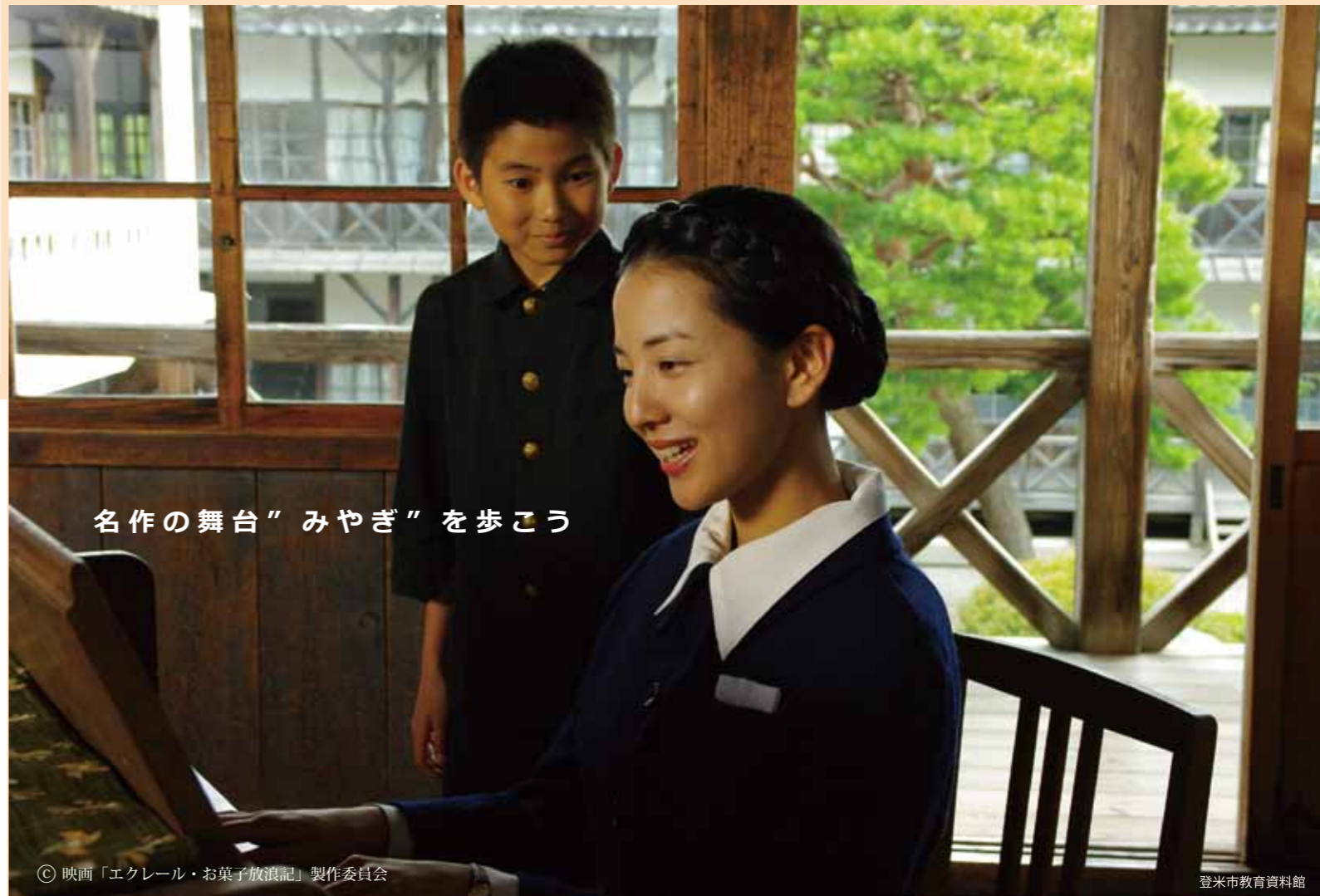
名作の舞台「みやぎ」を歩こう