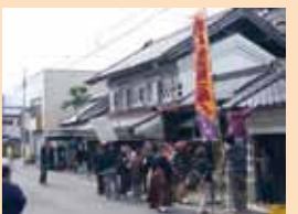
村田町蔵の街並み