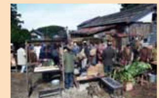
富谷町オープンセット